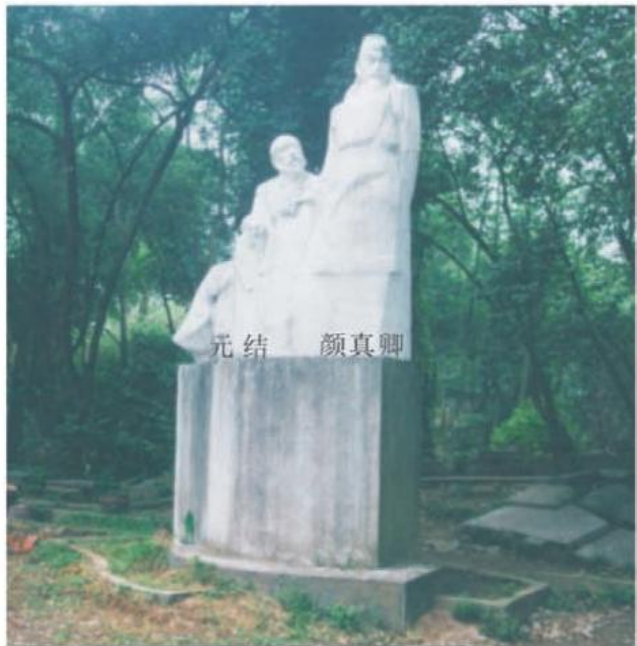
元结(左)与颜真卿像

的大唐王朝，因唐玄宗李隆基沉溺于奢华享乐，声色犬马之中。多年来一直荒于朝政，中央政权放弃军权，对叛乱更疏于防范，安禄山趁机纠集史思明、孙孝哲、阿史那承庆、田承嗣等武夫为部将，于天宝十四载（755年），在河北范阳、渔阳等地反叛。导致唐王朝面临土崩瓦解的危险。时颜真卿在河北平原太守任上，他首举平定叛乱的义旗，河北十七郡同时反正，复归朝廷，各路义军合兵二十万众，共推颜真卿为盟主，立志匡扶朝廷，平定叛乱。在平定安史之乱中立下丰功伟绩的颜真卿书写中兴颂时下笔激越高昂，气势磅礴，字字刚正雄伟，气度恢宏，精神内蕴，字里行间都充满刚毅之气。使中兴碑成为鲁公生平得意之笔，被誉为“宇宙杰作”，至今仍被世人顶礼膜拜。